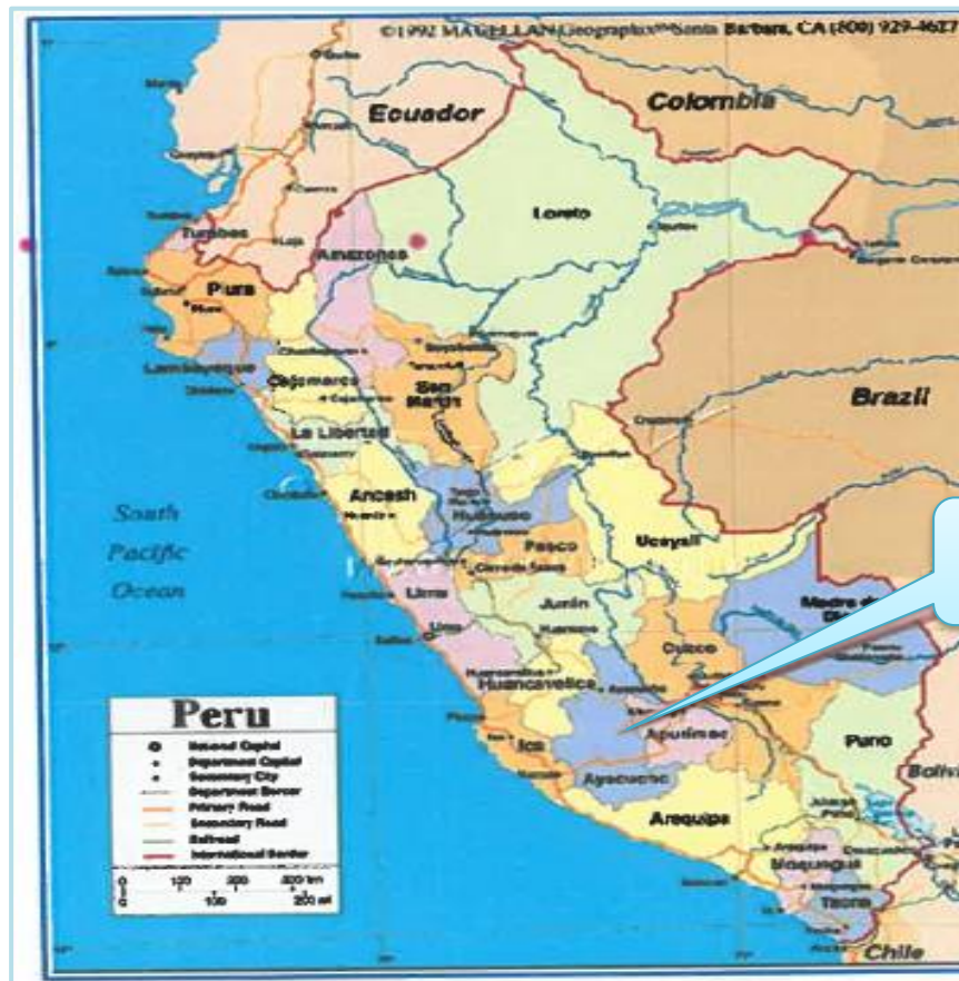
Mapa N° 01: Ubicación a nivel Nacional