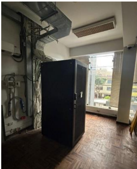
Imagen N° 04: Sala de Comunicaciones