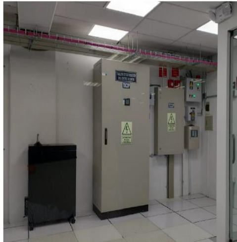
Imagen N° 2: Tableros eléctricos