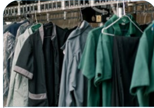
S02 Lavandería y ropería