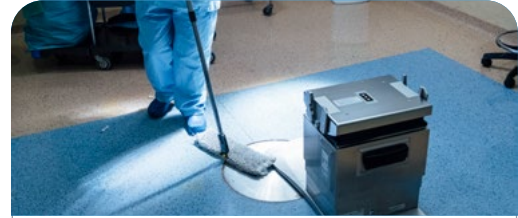
S03 Servicio de aseo, limpieza y manejo de vectores