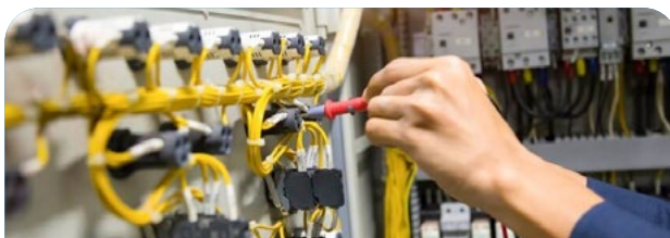
S07 Mantenimiento y operación de la edificación, instalaciones, equipamiento electromecánico y mobiliario asociado a la infraestructura