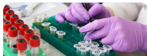
S09 Patología clínica