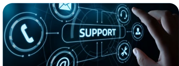
S10 Sistema informático de gestión de incidencias (SIGI)