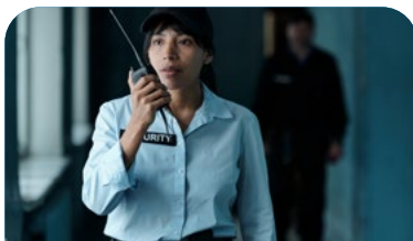
S04 Seguridad Integral y vigilancia