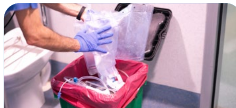
S05 Gestión integral y manejo de residuos sólidos