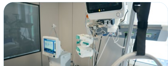
S08 Mantenimiento de equipo clínico y no clínico, incluyendo la actualización de la disponibilidad del equipamiento