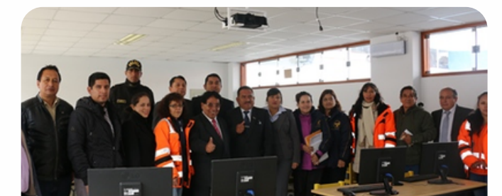
I.E. MANUEL GONZÁLEZ PRADA Aulas multimedia