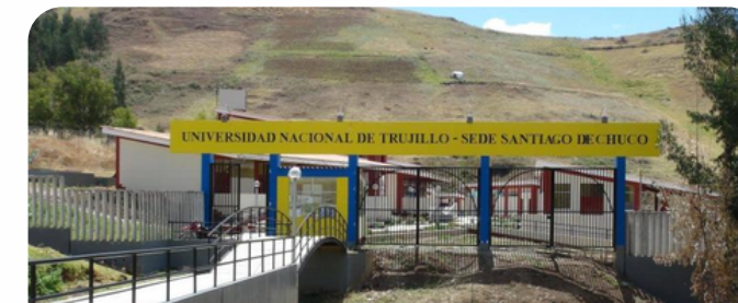
Construcción de Universidad Nacional de Trujillo Sede Santiago de Chuco