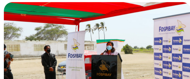
14 kilómetros de canales de riego en Piura