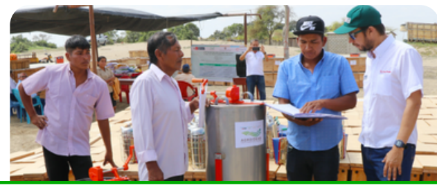
Mejoramiento de la productividad de miel de abeja