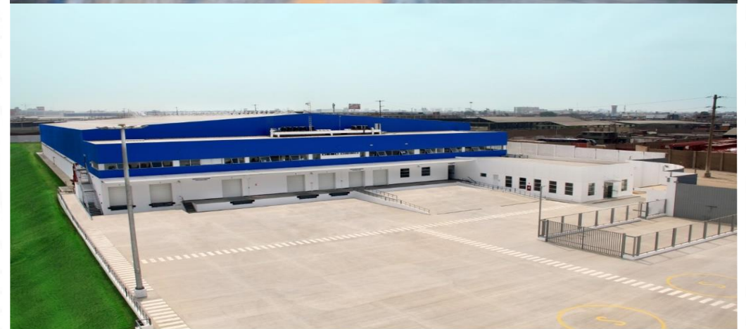
Construcción y Equipamiento del Centro de Distribución Lima SOCIEDAD OPERADORA SALOG S.A.