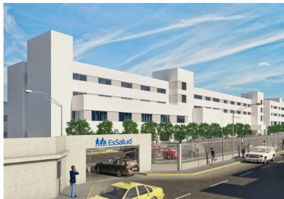
Complejo Hospitalario "Alberto Barton"