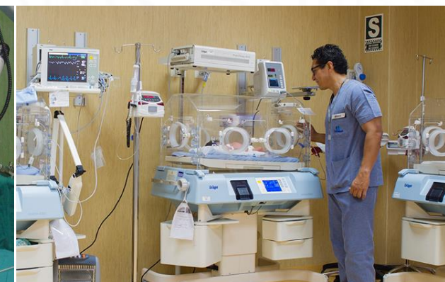
SOCIEDAD OPERADORA VILLA MARÍA DEL TRIUNFO SALUD S.A.C.