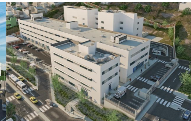
Complejo Hospitalario "Guillermo Kaelin"