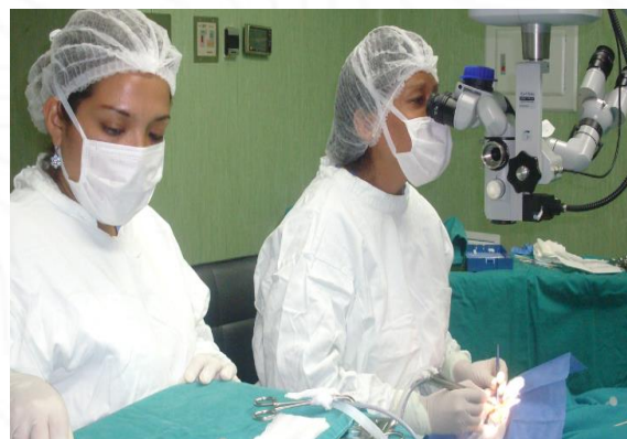
SOCIEDAD OPERADORA CALLAO SALUD S.A.C.